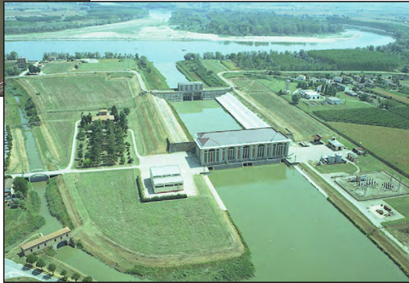
Vista aerea - Impianto Idrovo di scolo e derivazione idrica Pilastresi (loc. Stellata - Comune di Bondeno - FE)