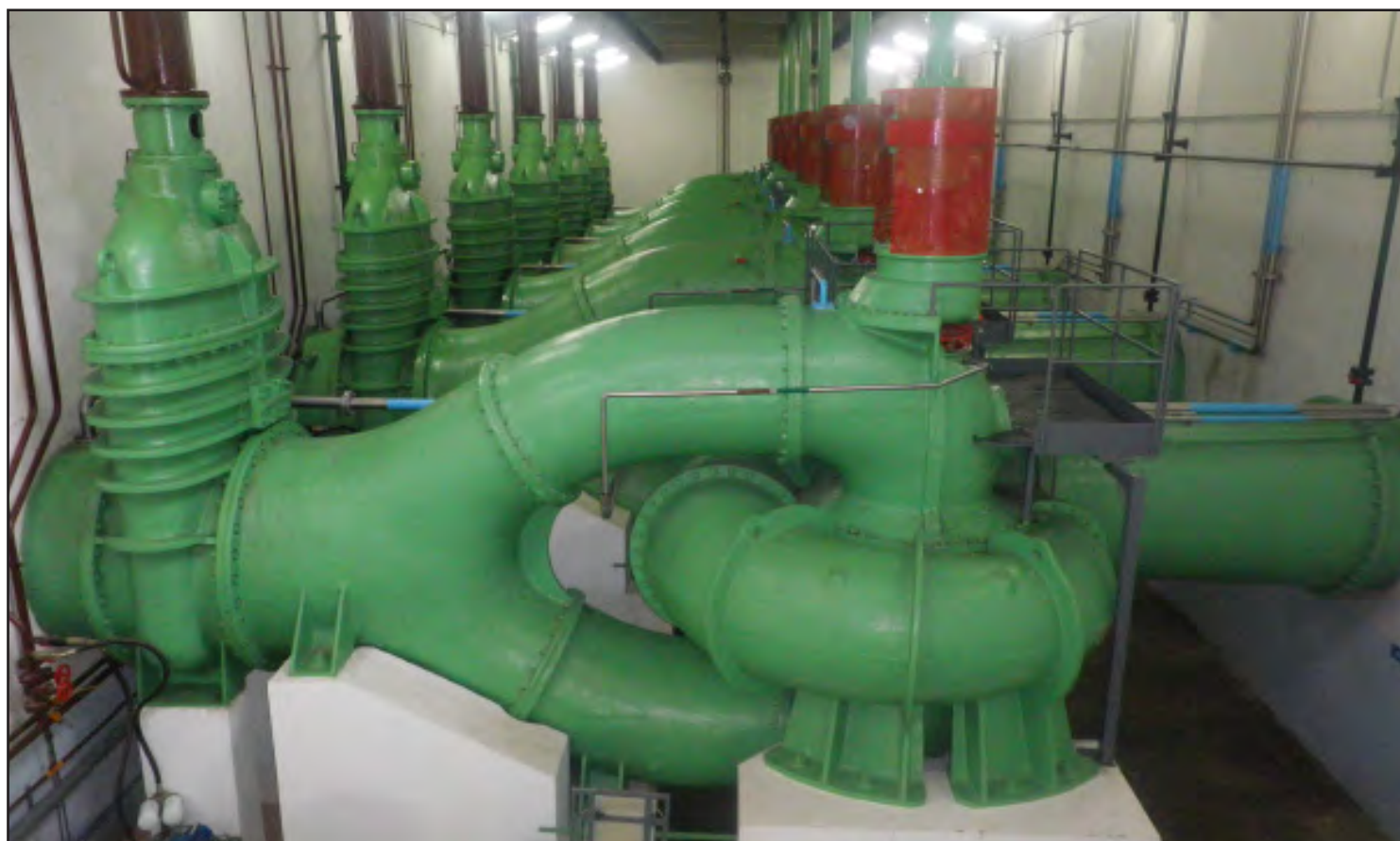
Vista degli interni