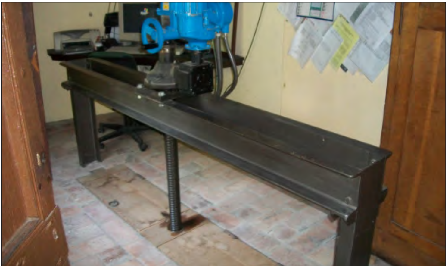
Vista degli interni