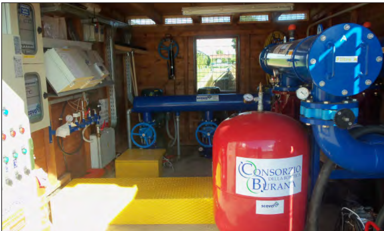
Vista degli interni