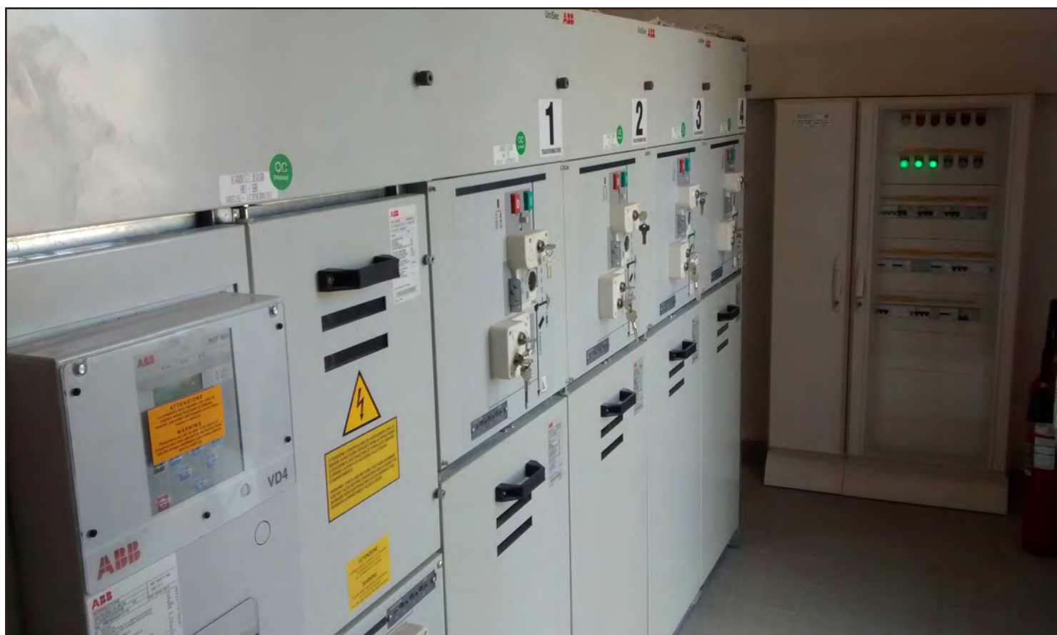
Vista degli interni