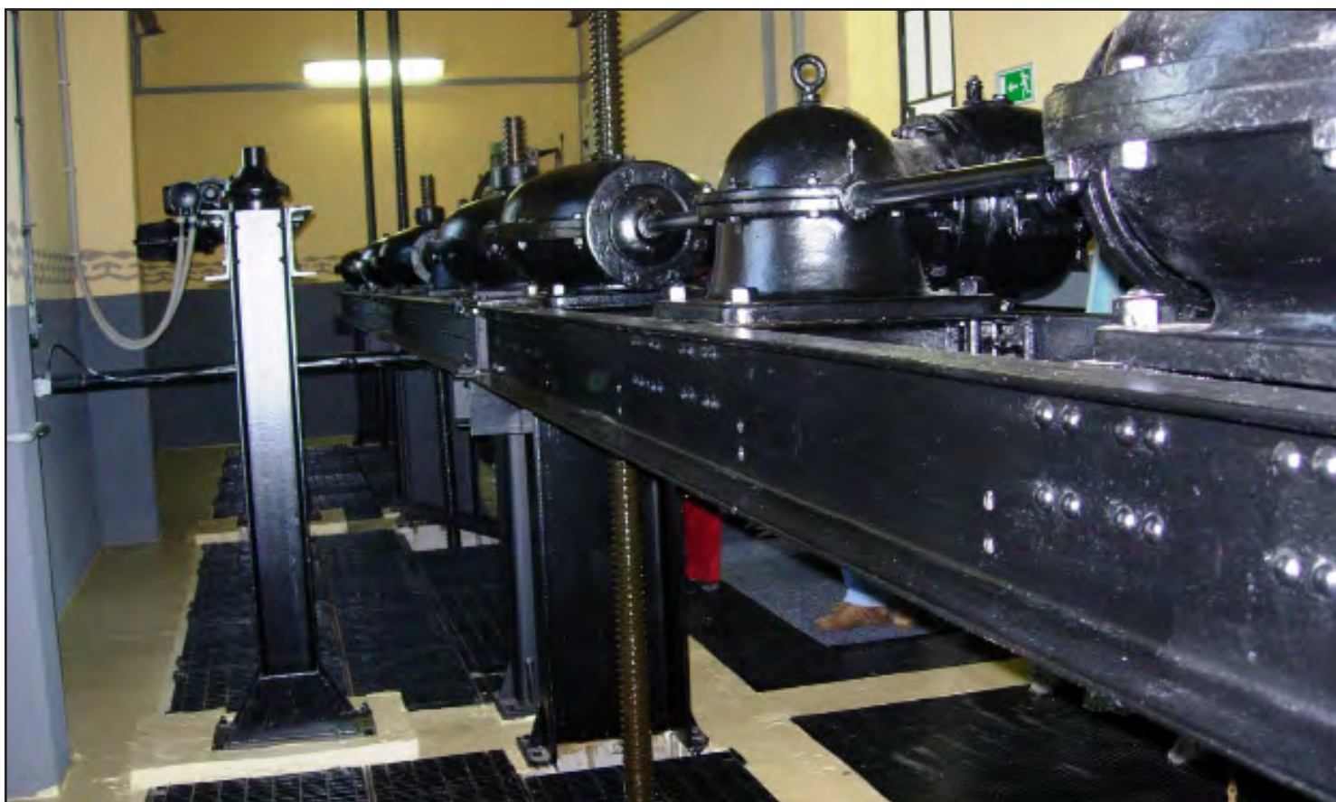
Vista degli interni