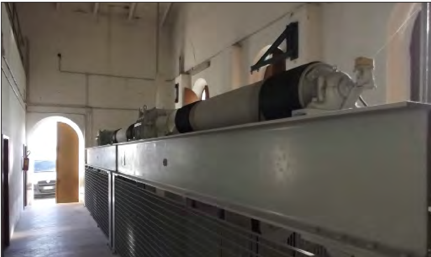
Vista degli interni