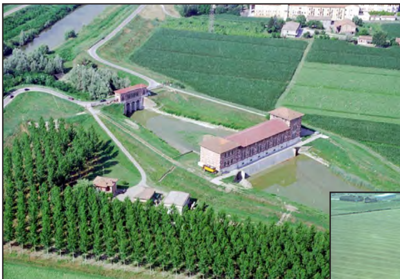
Vista aerea - Stabilimento idrovo di scolo Bondeno-Palata (loc. Santa Bianca Comune di Bondeno - FE)