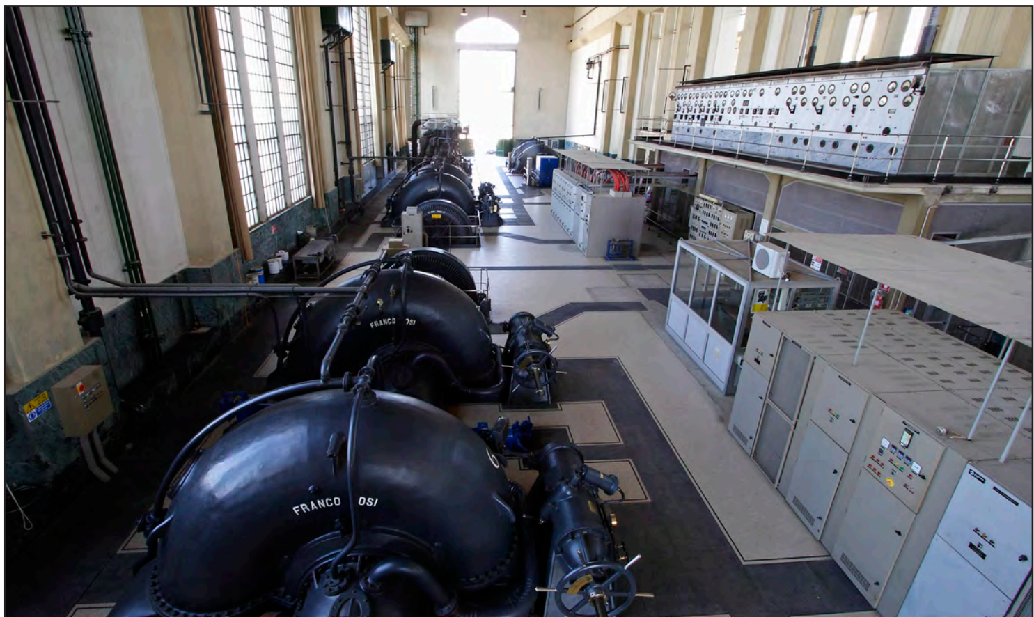
Vista degli interni