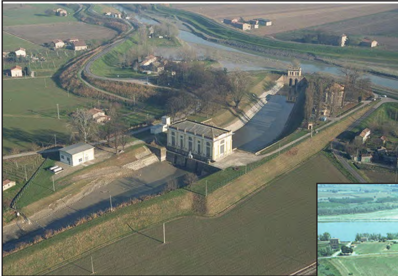
Vista aerea - Impianto Idrovo di scolo Santa Bianca (Comune di Bondeno - FE)