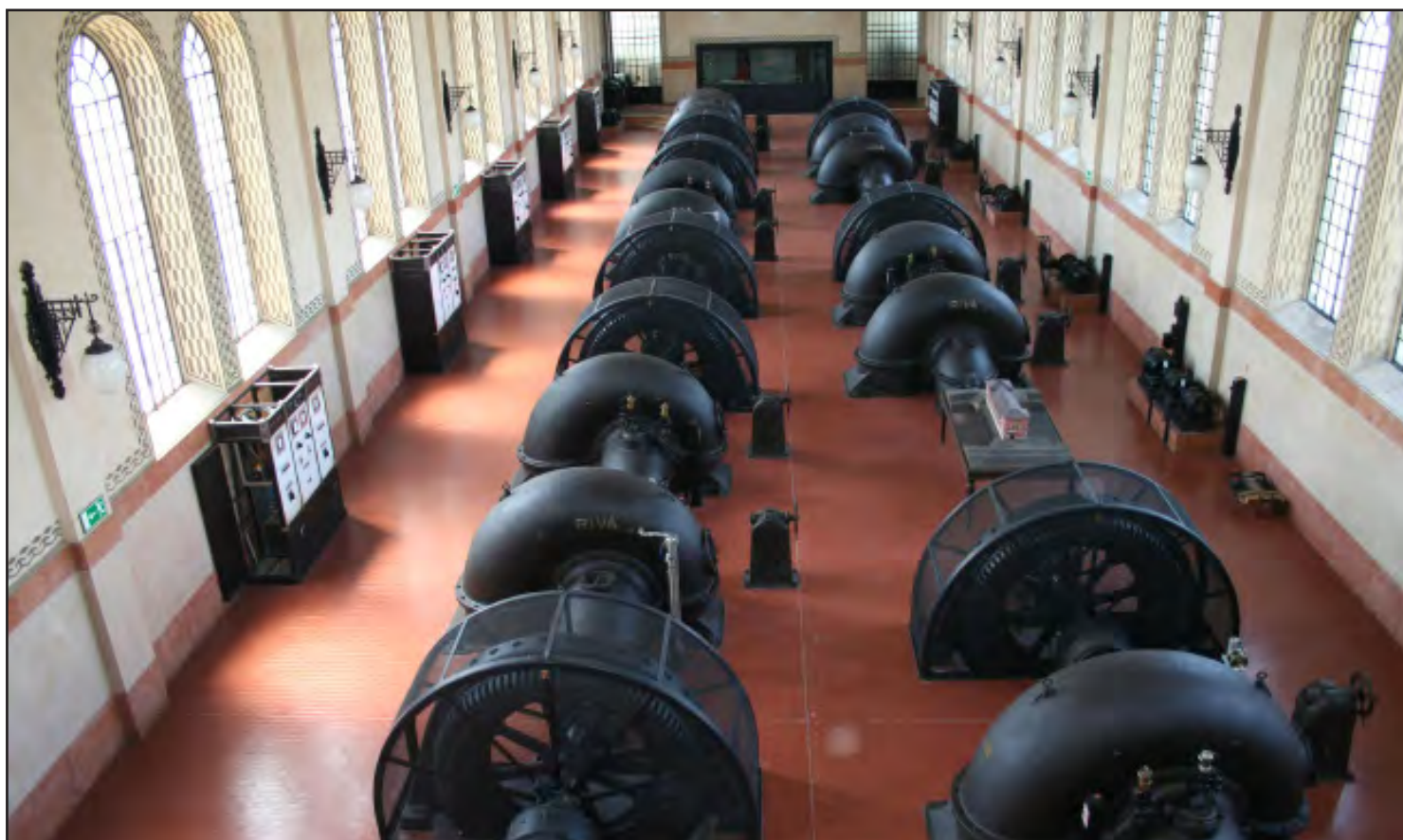
Vista degli interni