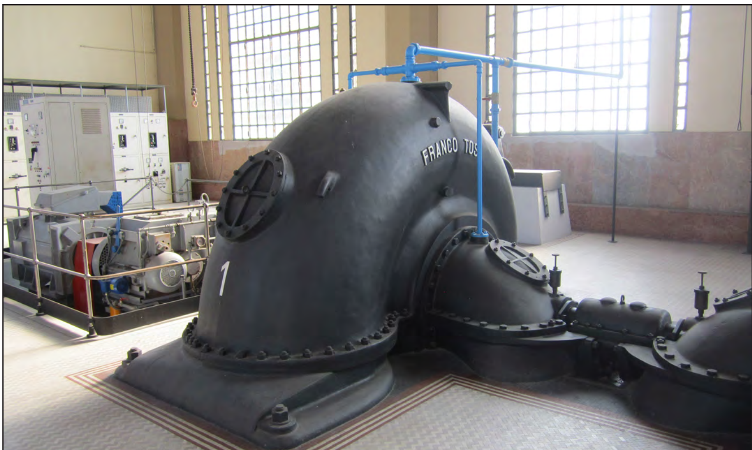
Vista degli interni