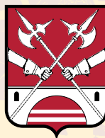
GUARDIANI DEI PONTI