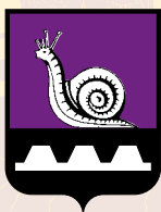
CERCHIA DELLA LUMACA