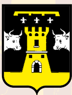
TORI DEL SEMINARIO