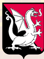
CERCHIA DEI DRAGONI