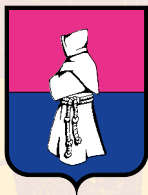
CERCHIA DEI CAPPUCCINI