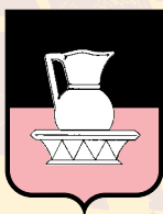
CERCHIA DELLA MAIOLICA