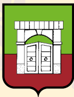
CERCHIA DEL PORTONE