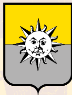
CERCHIA DI SAN LORENZO