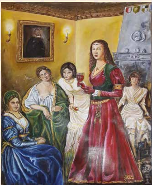
Palio realizzato dagli allievi del Club delle Arti di Finale Emilia