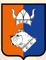
BULLDOG DI BOARIA